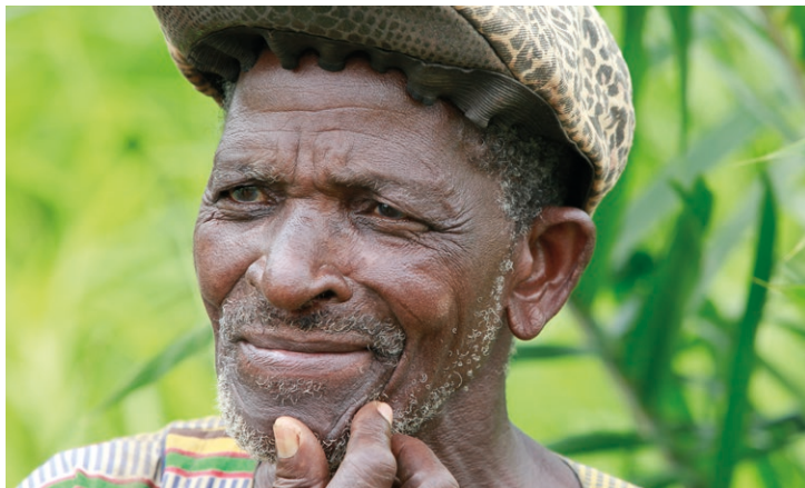
Adjoudjo stellt dem Projekt über ein Hektar Land zu Verfügung