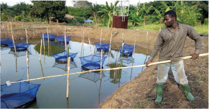
Essenszeit: Vor Ort fabriziertes Fischfutter wird sauber rationiert