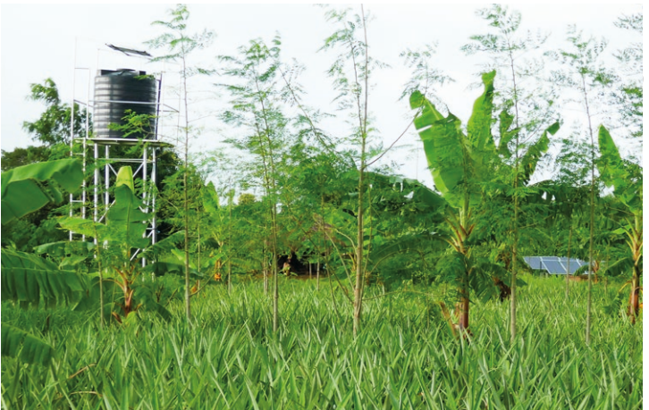
Agroforstwirtschaft: Regelmässige Baumreihen zwischen den Ananasstauden