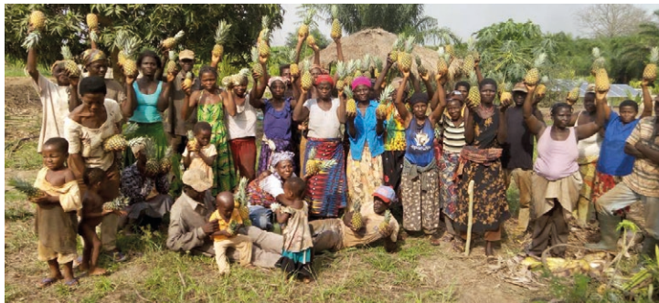
Die erste Ananasernte auf der Farm mit den Sorten Cayenne Lisse und Pain de Sucre

Bis Ende 2024 akquiriert das Team «Etoile Verte» eigenständig Gelder, sowohl für Forschungsaktivitäten und Lehre auf der Modellfarm und deren Weiterentwicklung, wie auch für die kontinuierliche Begleitung der Kooperative. Der Verein «Glück für Togo» betreibt weiterhin Vernetzungsarbeit und fördert spezifische Projekte auf der Farm.