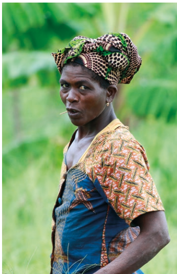
Die Pionierbäuerin Afi wendet die neu erlernten Techniken auf ihren eigenen Feldern an