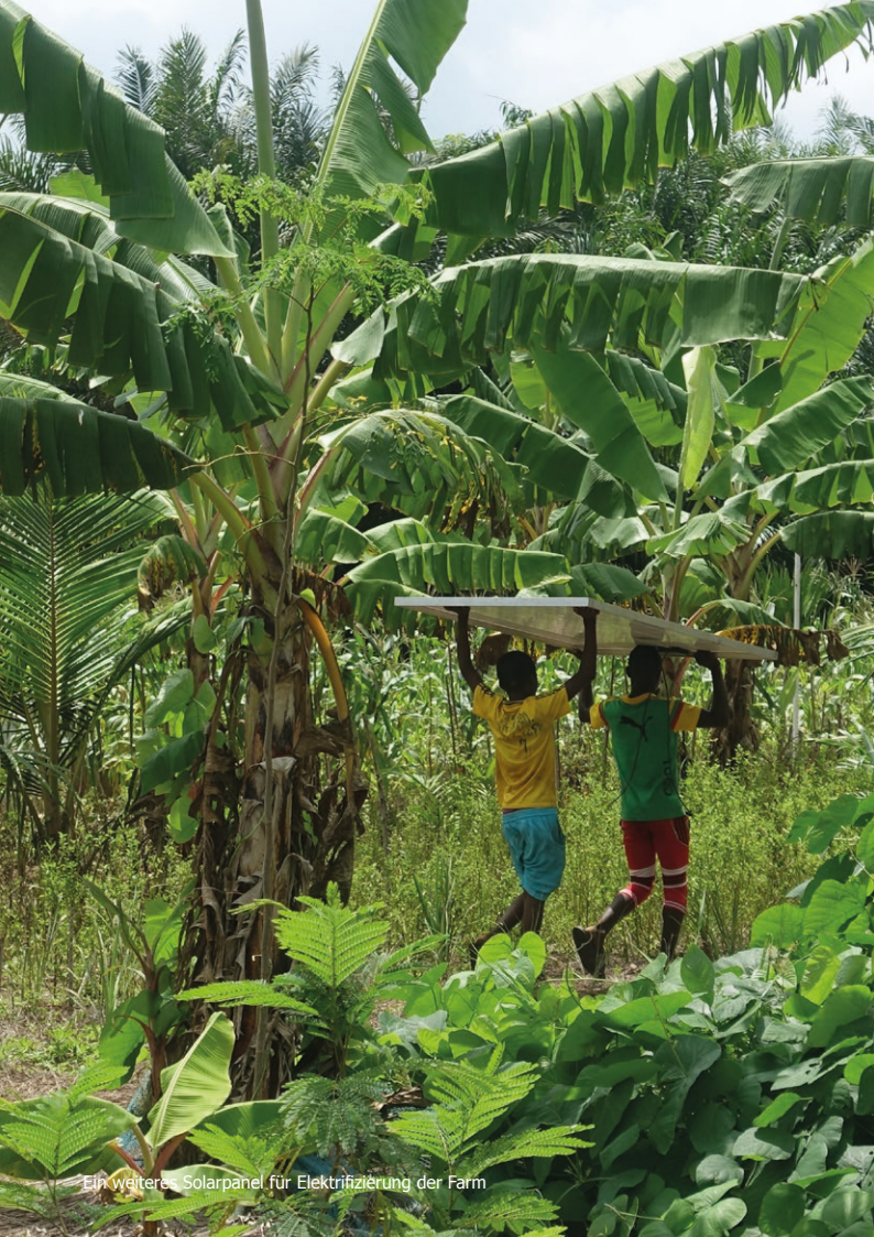
Ein weiteres Solarpanel für Elektrifizierung der Farm